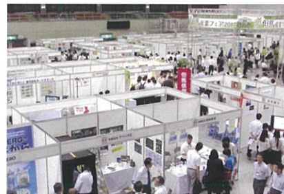
昨年度の会場の様子